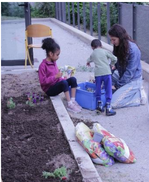
Plantation du massif de fleurs