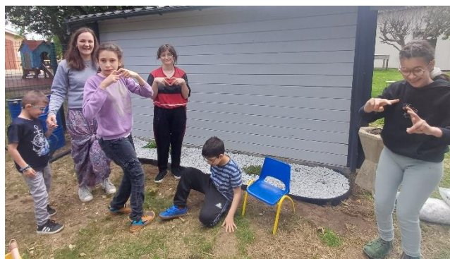
L'espace aromate est terminé !